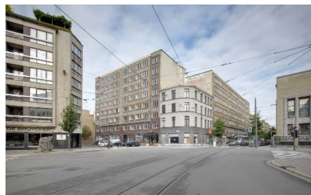
Tours Fierens Happel Cornelisse Verhoeven Architecten

Le transfert de mobilité exige une meilleure offre des modes de mobilité douce et partagée, qui sont également plus en phase les uns avec les autres et avec les modes de vie des personnes qui les utilisent. Les points de passage entre les différentes formes de mobilité sont les nouveaux lieux de rencontre urbains et l'endroit où vous faites vos courses ou faites réparer votre vélo. La nouvelle infrastructure représente le pivot du nouveau modèle de mobilité.