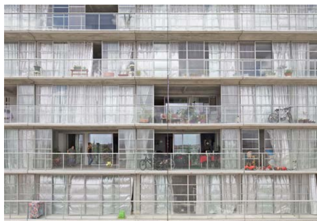
Grand Parc Lacaton & Vassal architects

La production d'aliments sains, rentables et abordables nécessite une nouvelle interaction entre les propriétaires fonciers (surtout en périphérie des villes) et les agriculteurs (anciens ou nouveaux). Les infrastructures créées à cet effet se présenteront sous différentes formes : nouvelles fermes (collectives), centres de formation, parcelles expérimentales ou centres de distribution et de vente urbains.