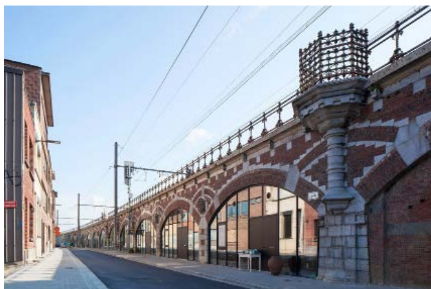
Centres Borgerhout NU Architectuuratelier