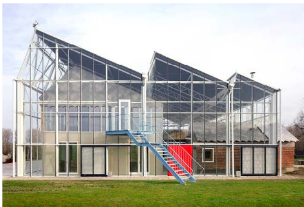
Centre paysager Paddenbroek jo taillieu architecten

Comment transformer notre cadre de vie afin d'atteindre les objectifs ambitieux que nous nous sommes fixés ? La Grande Rénovation fixe un ordre du jour de dix types de projets dont les semences existent déjà et qui laissent présager un avenir prometteur. Les dix Lieux d'avenir servent de toile de fond à l'exposition.