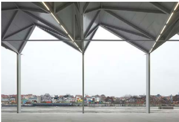
Village de matériaux de construction Vergotedok TETRA Architecten

L'innovation technologique, la production circulaire et la formation sont de plus en plus étroitement associées. De plus, elles gagnent en visibilité dans la ville et tissent de nouvelles relations de voisinage. Ces lieux de travail sont ouverts et multifonctionnels, des pôles où l'apprentissage et le renforcement des talents occupent une place centrale et où de nouveaux écosystèmes prospèrent entre différents types d'organisations et d'intervenants.