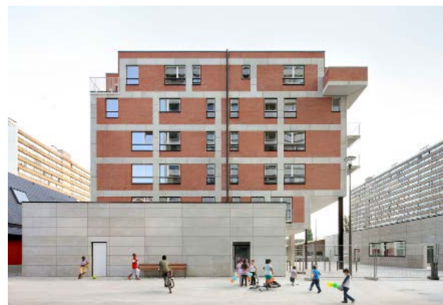
Projet Intergénérationnel Linkeroever (IGLO) De Smet Vermeulen architecten

Une infrastructure sociale est tout autant nécessaire pour des rencontres informelles et des actions collectives. Des lieux tels que les associations de quartier ou de jeunes, les restaurants sociaux, les églises réaffectées et les safe spaces sont intimement liés à la communauté. Ils renforcent le patrimoine social du quartier et encouragent de nouvelles dynamiques.