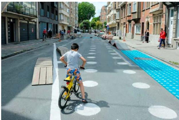
Rue Picard Filter Café Filtré