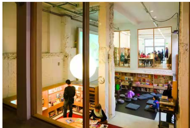
Maison ABC (Art Basics for Children) HUB