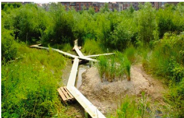
Source de Friche OOZE

La redistribution de la mobilité, la valorisation de l'eau et de la biodiversité et le renforcement de la cohésion sociale doivent trouver leur place dans nos espaces publics. Les systèmes de collecte d'eau pour le quartier, les projets de déminéralisation, les jardins de quartier ou les aires de jeux contribuent à tester les prototypes d'un profil de rue multifonctionnel.